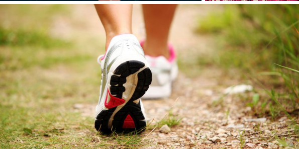
Warum Bewegung gut für dich ist – Tipps und Tricks für ein bewegliches Leben