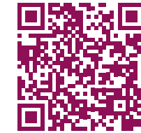
MYOBLATE™ RFA Procedure