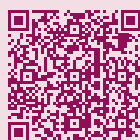
Frauenheilkunde / Gynäkologisches Krebszentrum

WEITERE INFORMATIONEN ERHALTEN SIE AUF DER HOMEPAGE des Marien-Hospitals Wesel unter der Rubrik Behandlungsangebote: