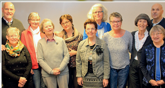
Das Team des Patientendienstes wurde 2016 mit dem Ehrenamtspreis der Stadt Wesel ausgezeichnet.